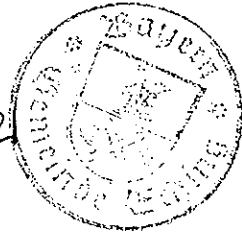
Josef Riemensberger Erster Bürgermeister