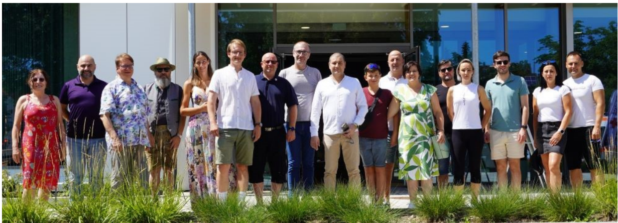
Gäste aus den Partnergemeinden Majs (Ungarn) und Trezzano (Italien) mit Vertretern/Begleitern der Gemeinde Eching

Das weitere Rahmenprogramm wurden von den Vereinen geboten, die sich in ihren Ständen präsentierten oder auch ihr Können zeigten. Vielerorts wurde zum Mitmachen animiert, so konnten die Interessierten beispielsweise bei den Schützen einmal selbst mit den Gewehren die Zielscheibe avisieren.