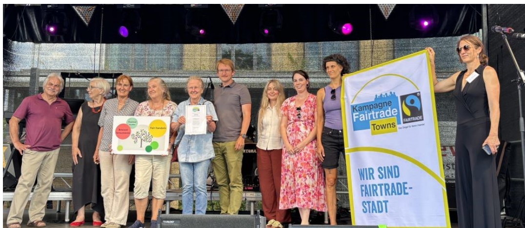
Fairtrade Steuerungsgruppe Eching

Die Gemeinde Eching wurde durch das Engagement der Fairtrade Steuerungsgruppe erneut durch Fairtrade Deutschland e.V. als Fairtrade Gemeinde rezertifiziert. Dieses wurde beim Gemeindefest offiziell den Bürgern verkündet und der Fairtradesteuerungsgruppe für Ihr Engagement gedankt.