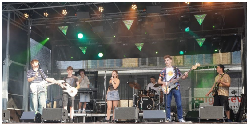
MTB Band der Musikschule Eching

Die Gemeinde Eching wurde durch das Engagement der Fairtrade Steuerungsgruppe erneut durch Fairtrade Deutschland e.V. als Fairtrade Gemeinde rezertifiziert. Dieses wurde beim Gemeindefest offiziell den Bürgern verkündet und der Fairtradesteuerungsgruppe für Ihr Engagement gedankt.